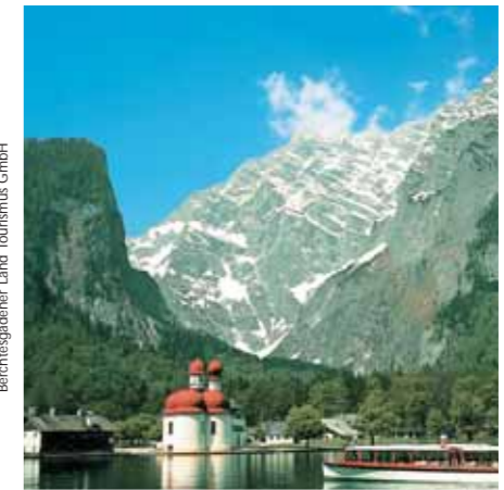
Berchtesgadener Land Tourismus GmbH