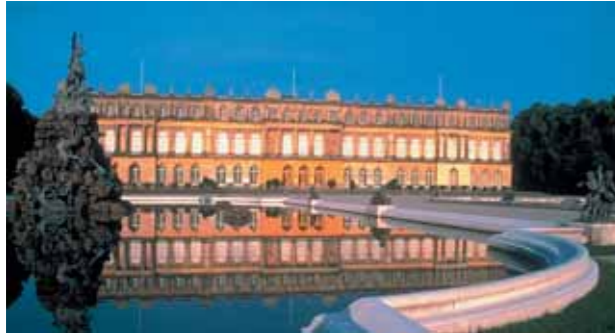
Chiemsee Tourismus KG