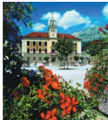
Stadt Bad Reichenhall

Auch Ausflüge in der Region lassen sich hervorragend mit öffentlichen Verkehrsmitteln bewältigen. Ein dichtes Busnetz ergänzt die Bahn. Ausflugslinien bringen Sie zu den schönsten Zielen, bis ins Hochgebirge und grenzüberschreitend, z.B. auf den Kehlstein, zum Königsee und über die Hochalpenstraße. An Schlechtwetter-Tagen kann die ganze