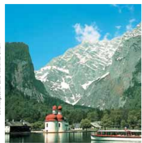
Berchtesgadener Land Tourismus GmbH