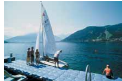
Europasportregion Zell am See

Ein besonderes Erlebnis ist die Rundreise mit Bus und Bahn auf der Route Bad Reichenhall – Lofer – Zell am See – Bischofshofen – Salzburg – Bad Reichenhall. Die Fahrt ist mehrmals täglich möglich. Erste Abfahrt (Bus 260/9528) ist 9:05 Uhr, nachmittags annähernd im Stundentakt. Ab Zell a.S. Weiterfahrt mit der Bahn. Gesamtfahrzeit ca. 3,5 Stunden.