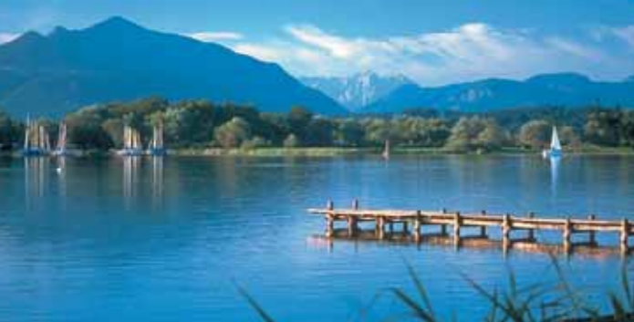
Chiemsee Tourismus KG