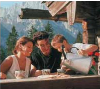
Berchtesgadener Land Tourismus GmbH

Doch auch in dieser Region sind Ruhe und Natur durch den zunehmenden Autoverkehr gefährdet. Dabei kommt man hier leicht auch ohne das Auto voran, denn alle interessanten Orte der Region sind gut mit der