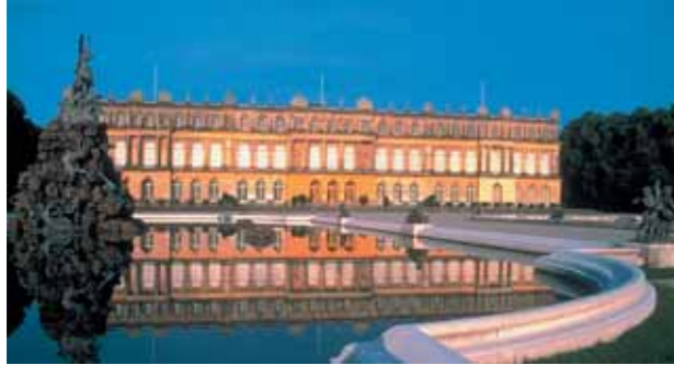
Chiemsee Tourismus KG