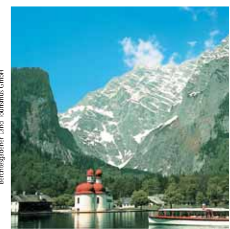
Berchtesgadener Land Tourismus GmbH